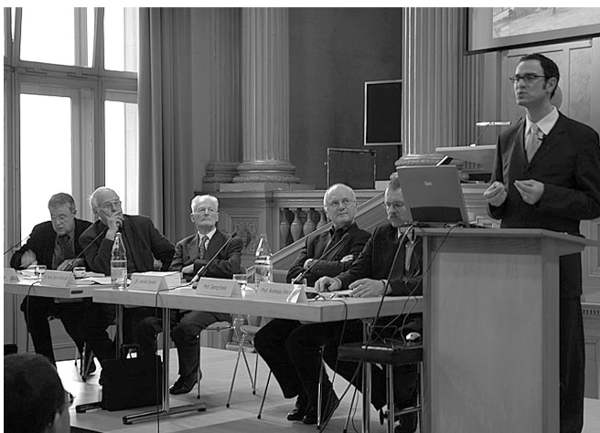
Vernissage am 1.2.05

Die geheim operierenden Stay-behind-Armeen wurden während des Kalten Krieges mit der Gefahr einer russischen Invasion motiviert und gerechtfertigt; sie sollten im Falle einer solchen Invasion hinter den Frontlinien agieren. Doch zu den Zielsetzungen dieser in allen NATO-Ländern errichteten Geheimarmeen gehörte auch die Verhinderung der Machtergreifung kommunistisch dominierter Regierungen. Diese Gefahr bestand sowohl in Italien (1964) wie in Griechenland (1967) und wurde in beiden Ländern durch Gladio-ähnliche Operationen staatsstreichmäßig ausgeschaltet.